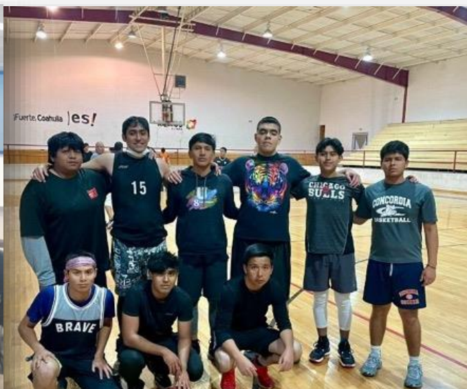
12 de febrero Partido de Baloncesto entre UPRA y preparatoria IMARC