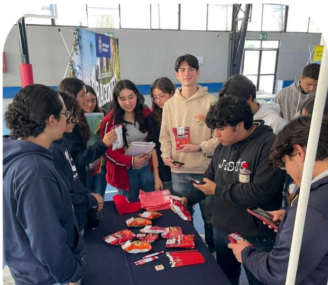
21 de octubre Asistencia a Feria de Promoción en IESS