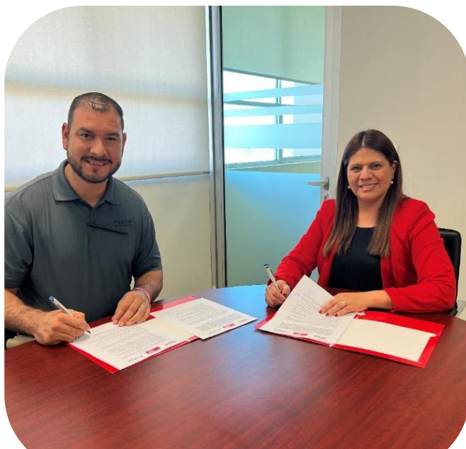
16 de octubre Firma de Convenio con empresa "PUREM"