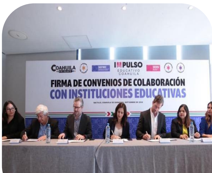
09 de septiembre Asistencia a Firma de Convenio entre SEFIRC y Universidades Particulares