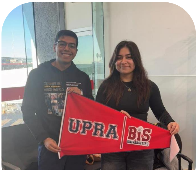
29 de noviembre Alumnos realizan movilidad internacional a Toronto Canadá