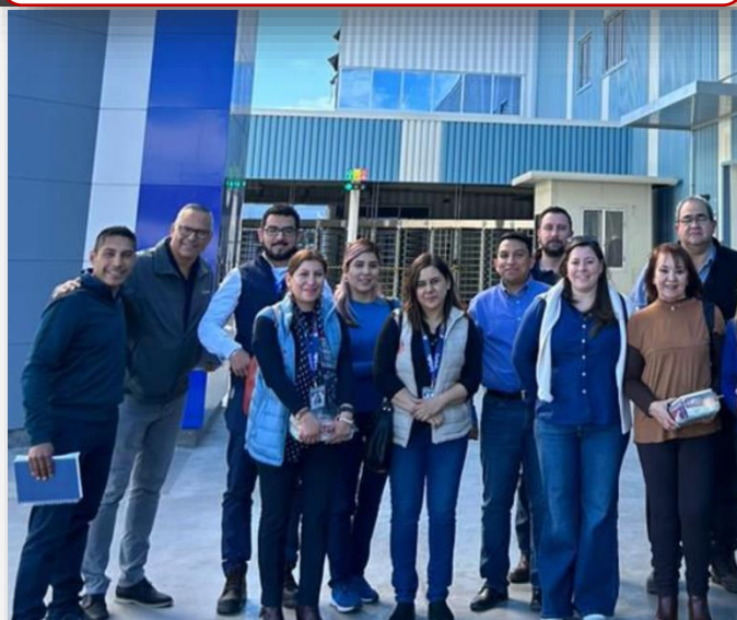
14 de febrero Asistencia a reunión Bimestral del Consejo de Vinculación Universidad Empresa