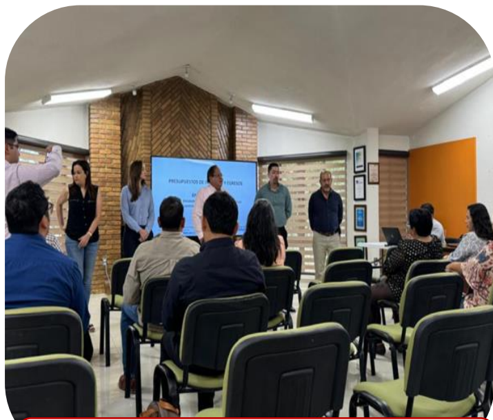
22 de agosto Capacitación de Presupuesto de Ingresos y Egresos