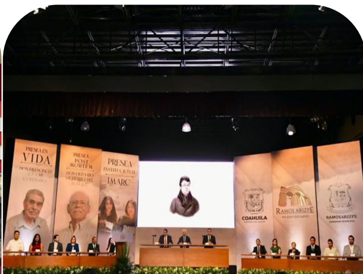
13 de mayo Asistencia al premio "Presea Miguel Ramos Arizpe"