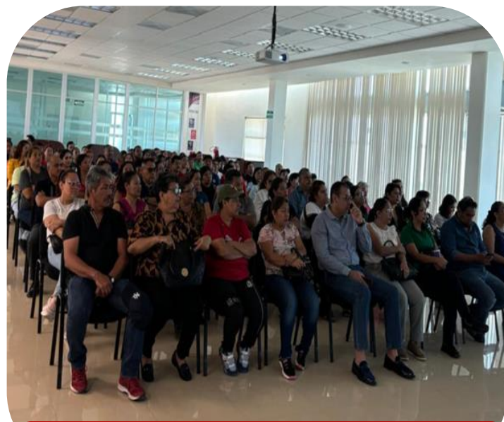
27 de agosto Inducción a padres de familia de alumnos de nuevo ingreso