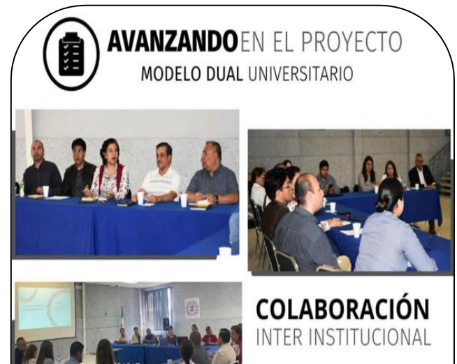
16 de Abril Participación en la reunión para revisión del programa Piloto "Modelo Dual"