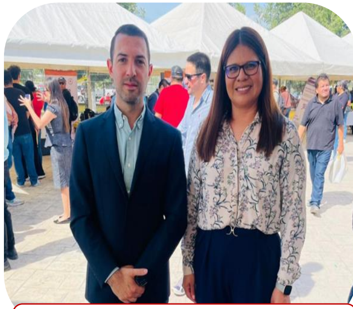
20 de agosto Asistencia a Feria del Empleo en Ramos Arizpe