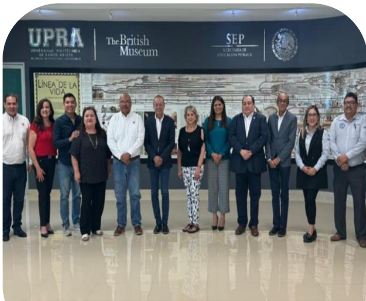
08 de julio Sede de reunión del programa piloto de fortalecimiento de inglés