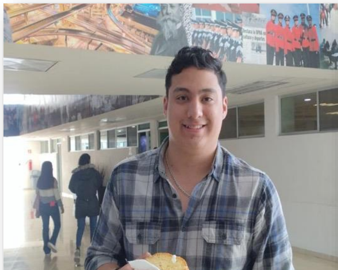
08 de enero Se comparte Rosca de Reyes con alumnos y docentes de la Universidad