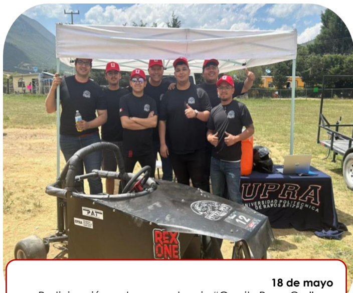
18 de mayo Participación en la competencia "Gravity Race Car"