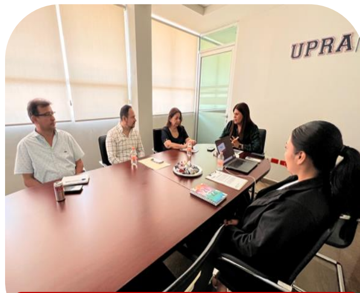
21 de agosto Tercera Sesión Ordinaria de COCODI