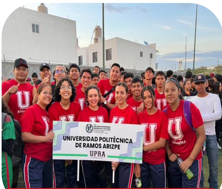
Participación en Inter Tecnológicos Etapa Regional