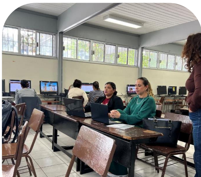
21 de octubre Asistencia a capacitación sobre información de Estadística