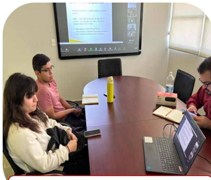
12 de septiembre Reunión Informativa para alumnos de movilidad a Canadá