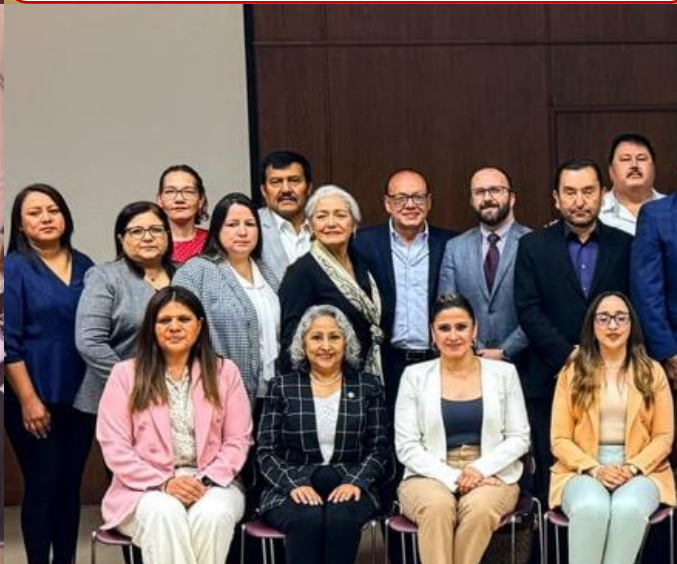
07 de marzo Asistencia a Reunión del Consejo de Transparencia organizada por el ICAI