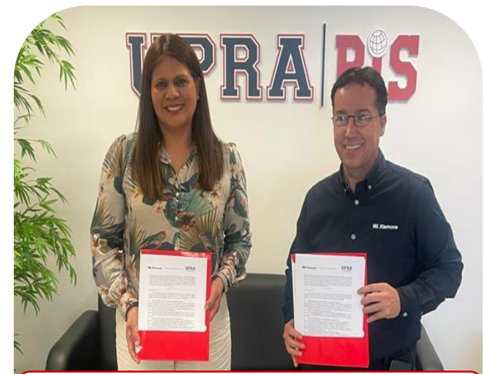
08 de mayo Firma de Convenio de la empresa HL KLEMOVE