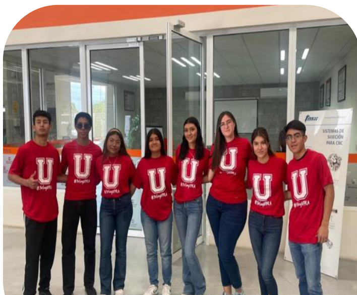
08 de agosto Visita a instalaciones de Herramental Monterrey