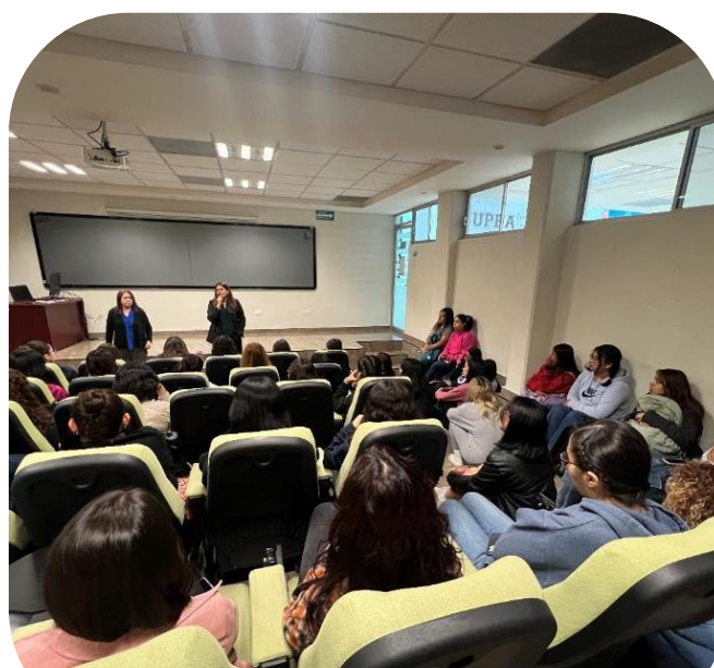
Plática de promoción para Becas de Fundación Holcim 14 de octubre