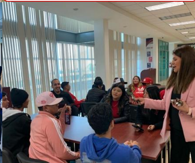
14 de febrero Festejo del Día del Amor y la Amistad en UPRA