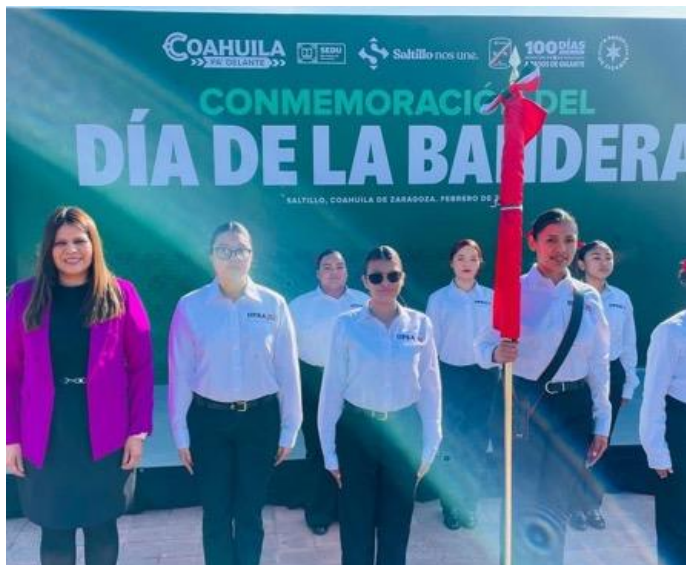
24 de febrero Participación de la UPRA en Conmemoración del Día de la Bandera