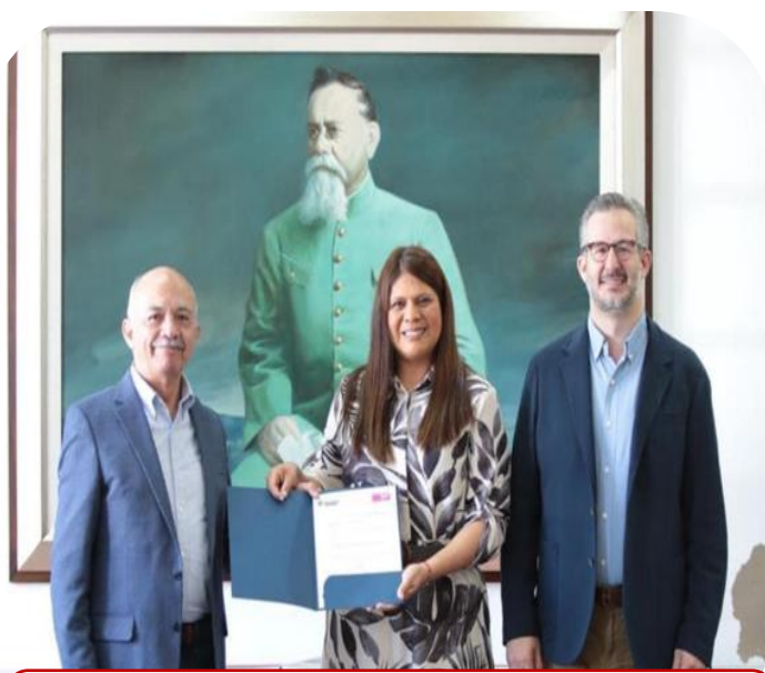
19 de julio Nombramiento de Rectora de la UPRA