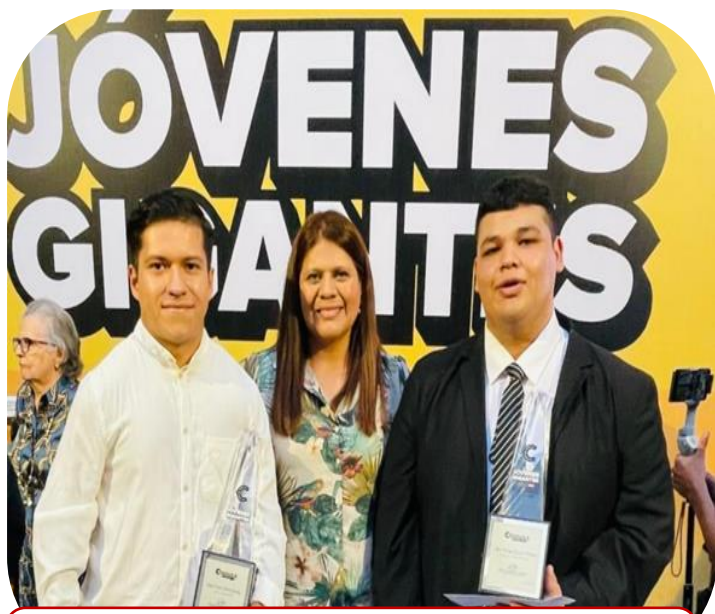
30 de agosto Entrega del premio Estatal de la Juventud 2024 "Jóvenes Gigantes"