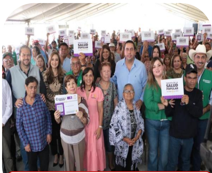
24 de septiembre Asistencia al programa de Salud Popular