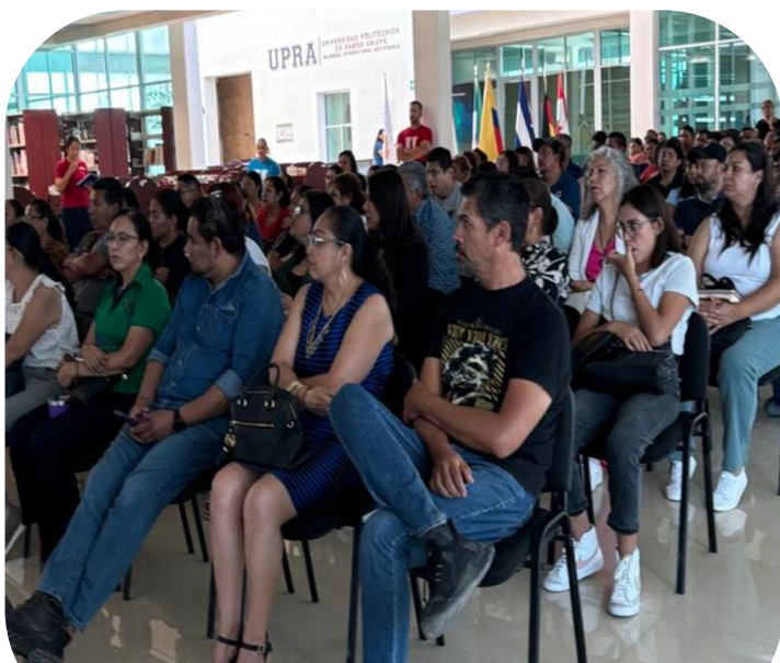
19 de julio Reunión informativa con padres de familia