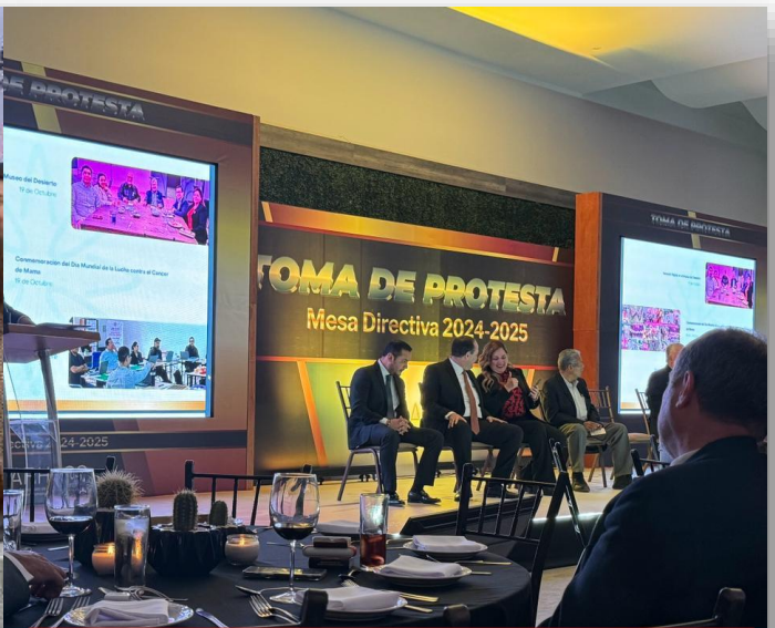
29 de febrero Asistencia a toma de Protesta de la Mesa Directiva 2024 de "ARHCOS"