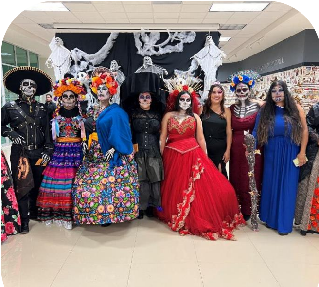
Concurso de Catrinas en UPRA 02 de noviembre