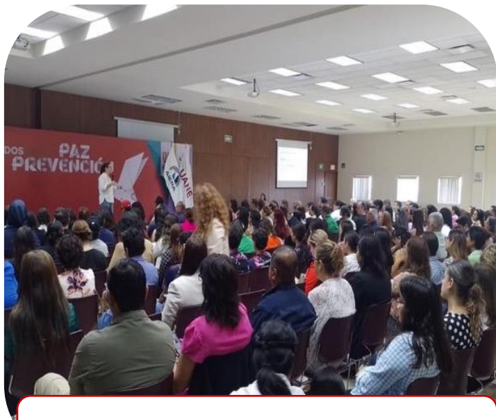
25 de septiembre Plática de prevención del Suicidio por AIERA