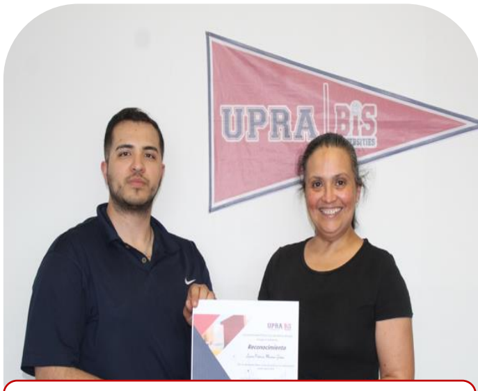
12 de junio Reconocimiento a excelencia docente durante el primer cuatrimestre 2024