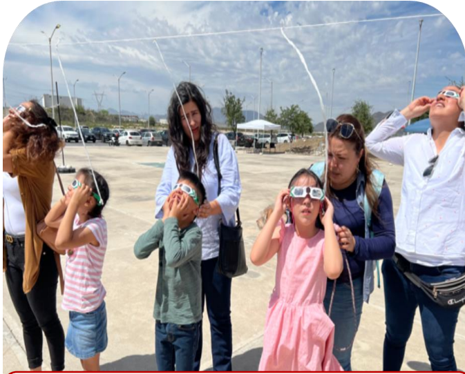
08 de Abril Centro de Observación oficial para el eclipse solar 2024