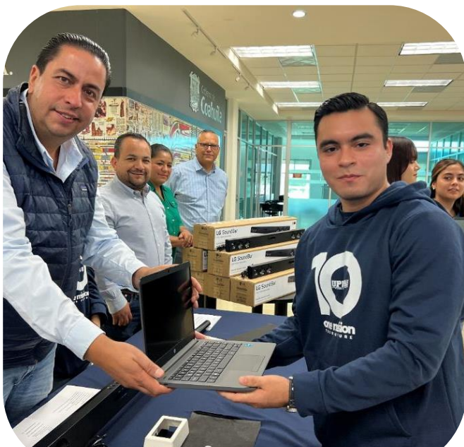
15 de octubre Entrega de Equipamiento "Mejora tu Escuela"