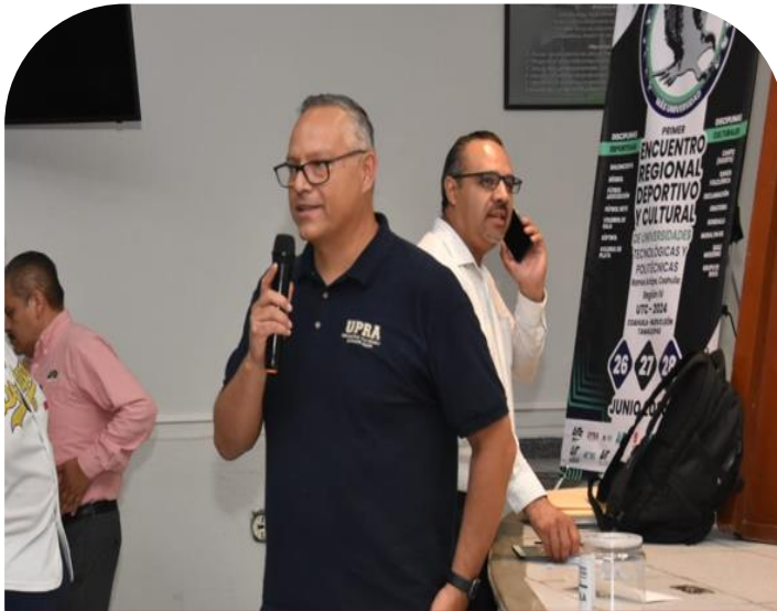
16 de junio Junta técnica del encuentro nacional cultural y deportivo de Universidades Tecnológicas y Politécnicas etapa Regional