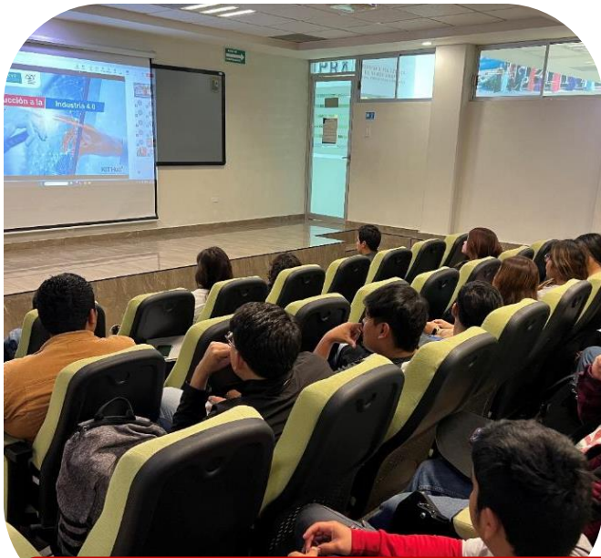
12 de noviembre Asistencia a conferencia virtual "Introducción a la industria 4.0"