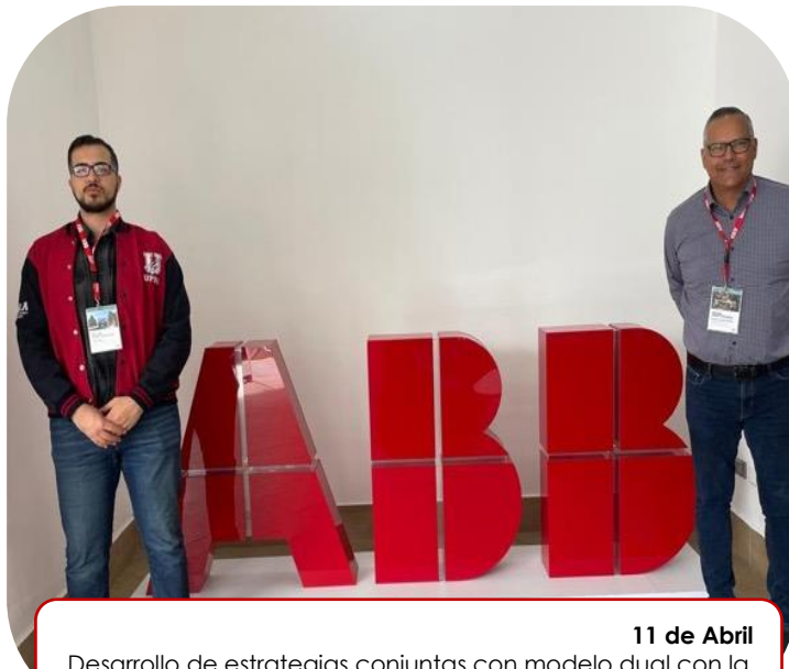
11 de Abril Desarrollo de estrategias conjuntas con modelo dual con la empresa "ABB"