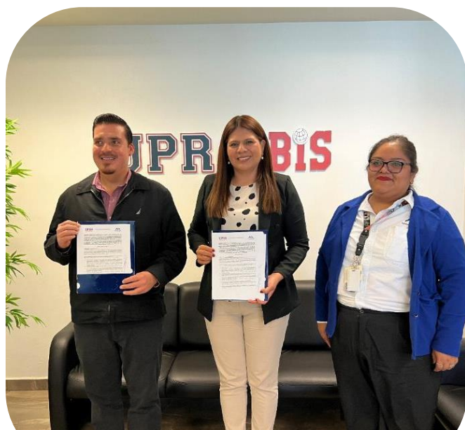
Firma de Convenio con la empresa Tatewaki 11 de octubre