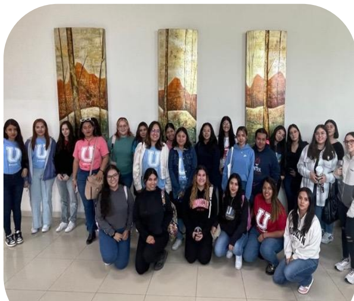
25 de septiembre Asistencia a Plática "Cuando me gradúe, ¿Qué sigue?"