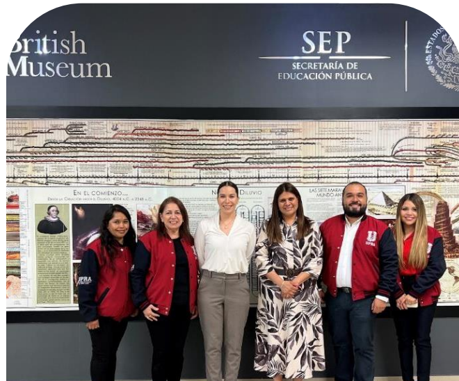
28 de octubre UPRA sede de H. Juntas Directivas