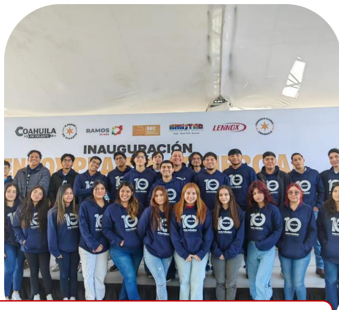
22 de noviembre Asistencia a Inauguración de nueva planta LENNOX