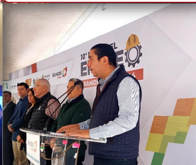
20 de febrero Participación de UPRA en la décima Feria del Empleo Ramos Arizpe