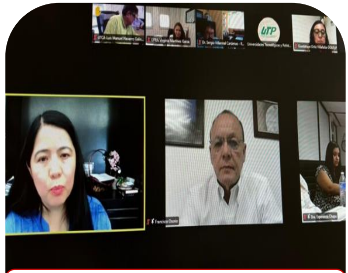
12 de junio Reunión para transición de nueva oferta educativa de las Universidades Politécnicas