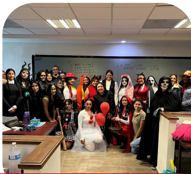
31 de octubre Celebración de Halloween