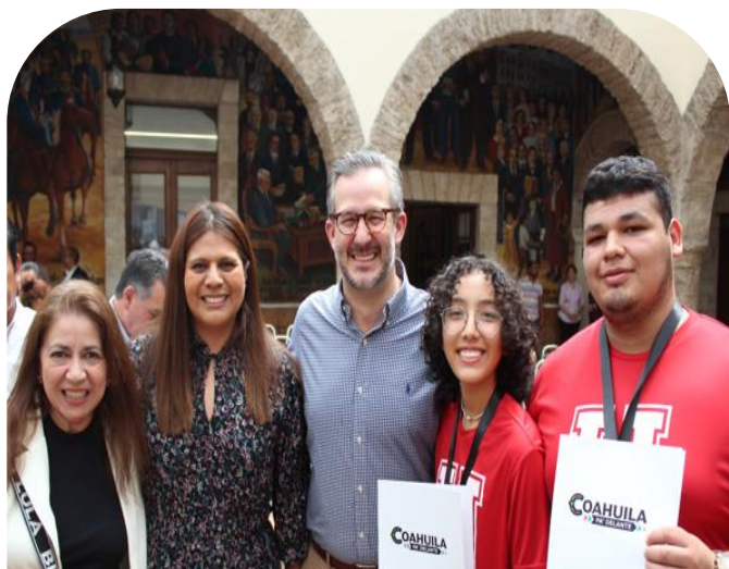
30 de mayo Entrega de reconocimientos "Estudiantes Gigantes 2024"