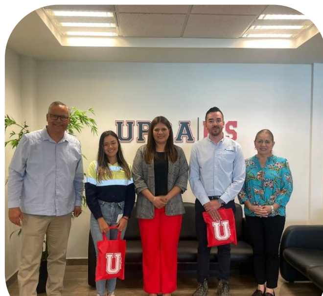
Visita de Fundación Holcim 03 de octubre