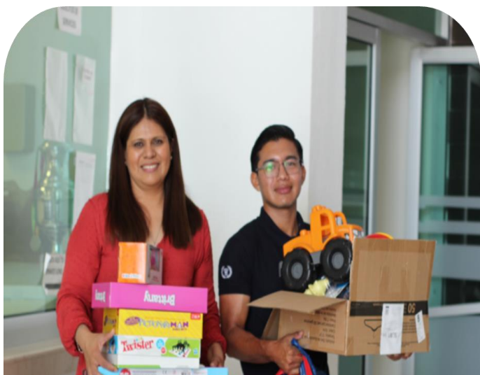
30 de Abril Colecta de juguetes por el día del niño