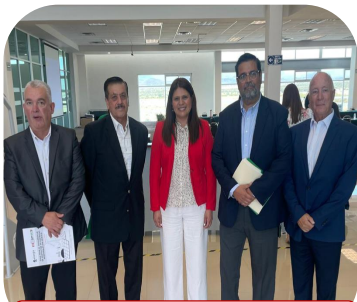
28 de agosto Sesión Bimestral del Consejo Universidad Empresa de COPARMEX