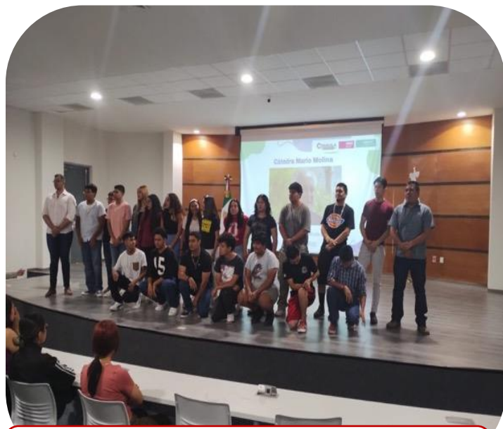
22 de agosto Asistencia a pláticas en el COECYT