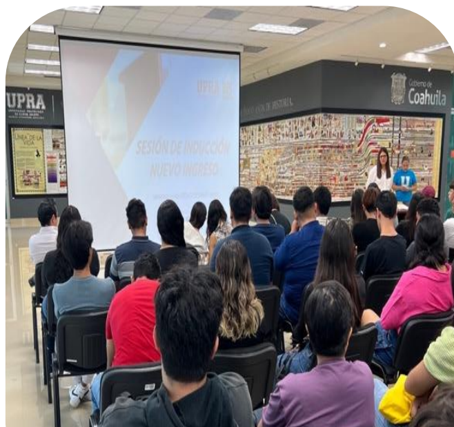
30 de agosto Reunión de inducción con alumnos de nuevo ingreso