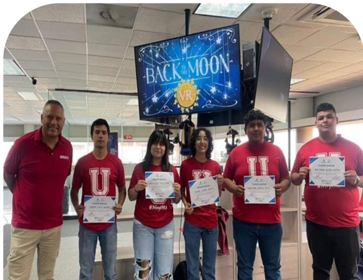
14 de mayo Maratón de Innovación del Consejo Universidad-Empresa