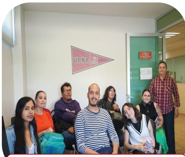
17 de septiembre Reunión de academia de Inglés