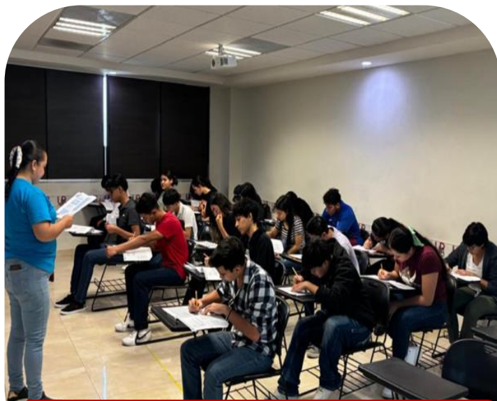
Segundo examen de admisión