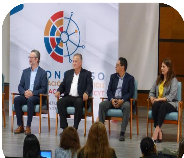
26 de septiembre Asistencia a 1er congreso de Investigación del FONCYT