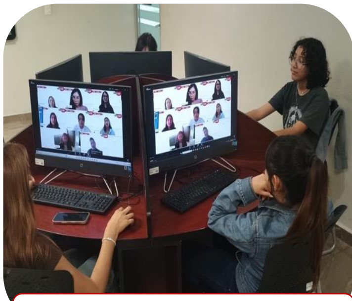
12 de septiembre Conferencia Virtual para mujeres en STEM