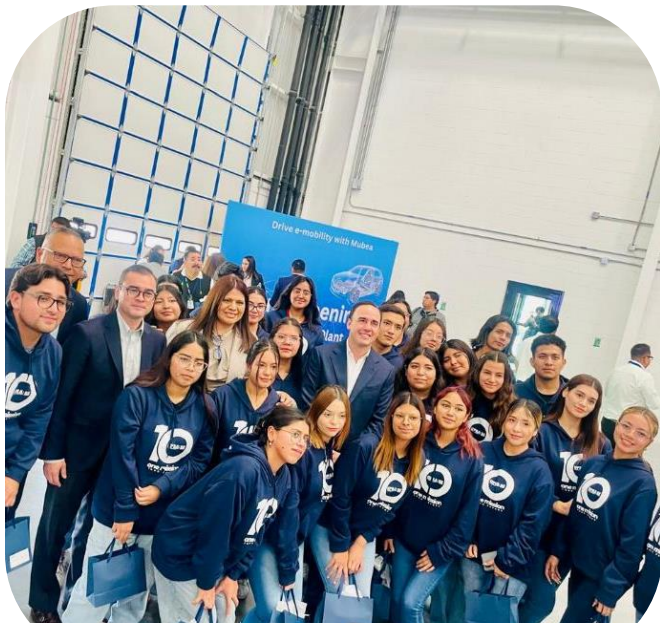
12 de noviembre Asistencia a Inauguración de planta MUBEA Ramos Arizpe