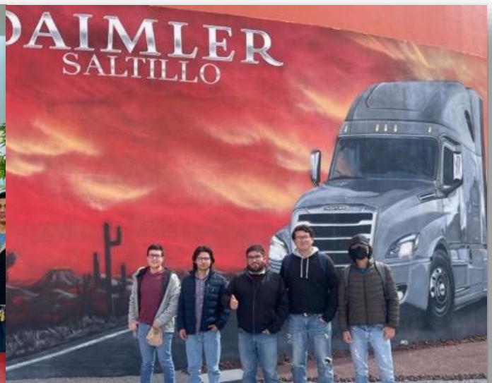
09 de febrero Visita de alumnos de la UPRA a la empresa Daimler para proceso de reclutamiento