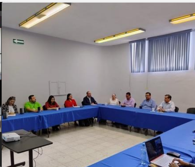
15 de marzo Reunión de Seguimiento para implementación de Modelo Dual