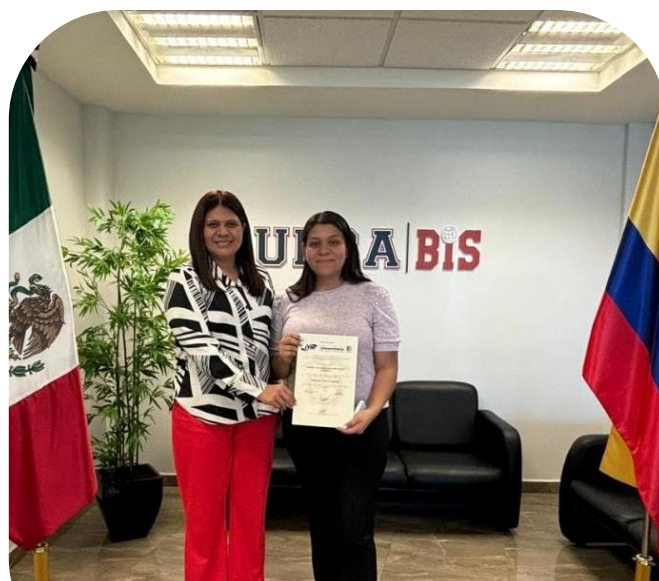
15 de noviembre Primera Egresada de UPRA obtiene doble Titulación con Colombia