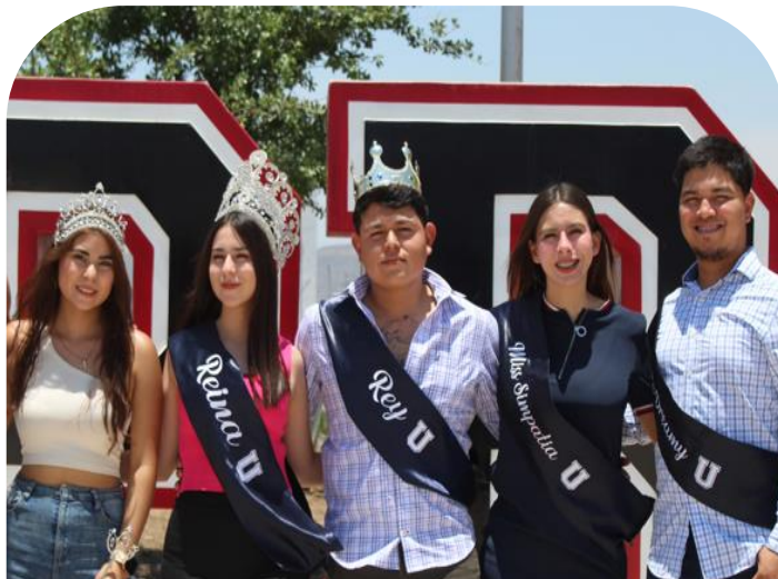
23 de mayo Coronación de Reyna y Rey UPRA 2024