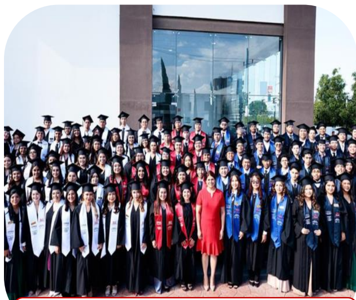
29 de agosto Graduación de la UPRA 2024