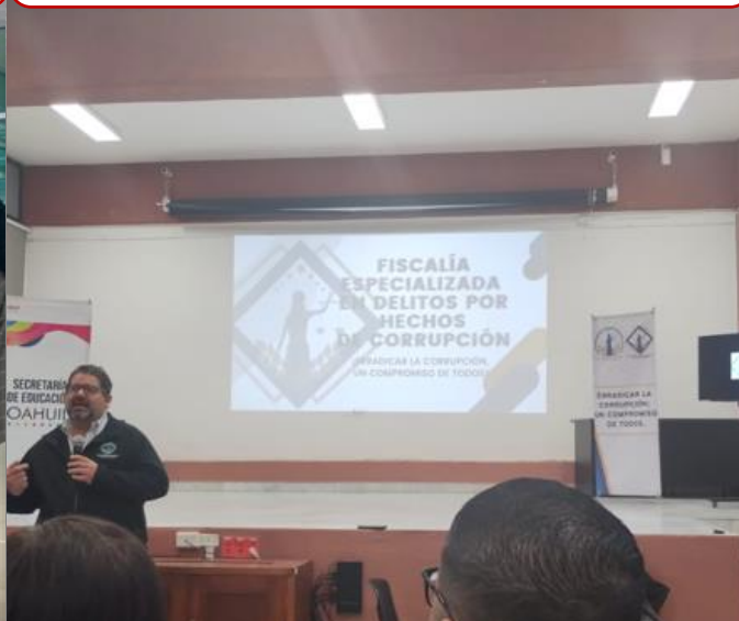
20 de marzo Asistencia a plática "Erradicar la corrupción" impartida a administrativos por parte de la Fiscalía Especializada