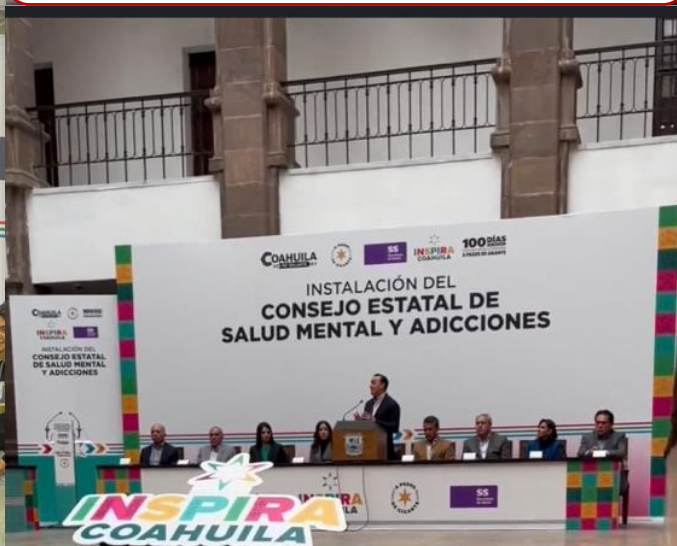
22 de enero Asistencia a instalación del Consejo Estatal de Salud Mental y Adicciones