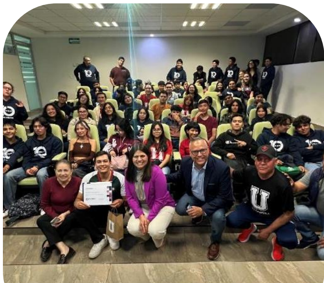
28 de noviembre Plática del atleta Olímpico Matías Grande