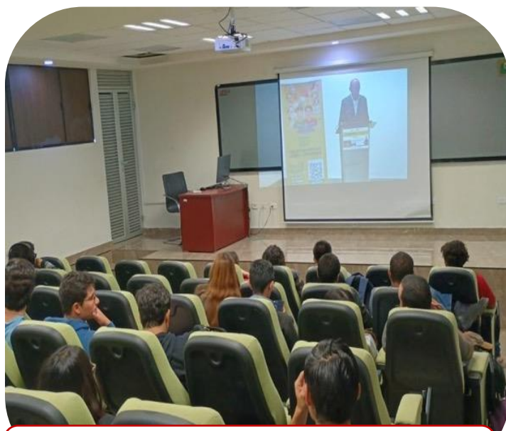
18 de septiembre Conferencia Virtual sobre la importancia de los sistemas informáticos