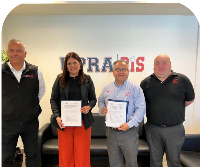
19 de noviembre Firma de Convenio de Colaboración con Innova Bienestar