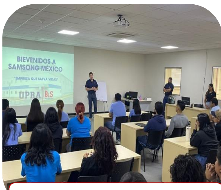
02 de julio Visita a la empresa SAMSUNG