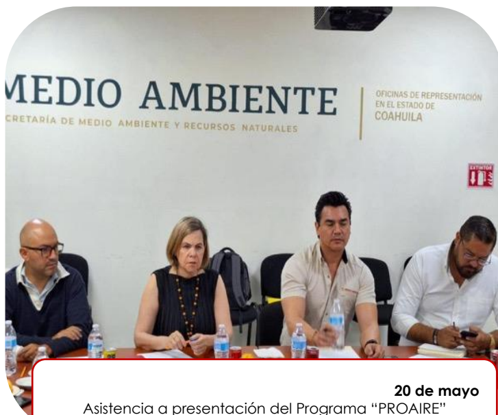
20 de mayo Asistencia a presentación del Programa "PROAIRE"