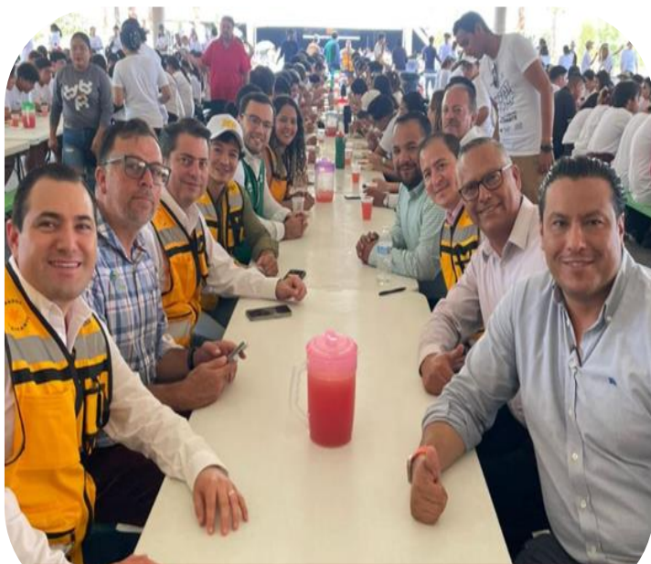
22 de agosto Participación en el Boot Camp por la Juventud