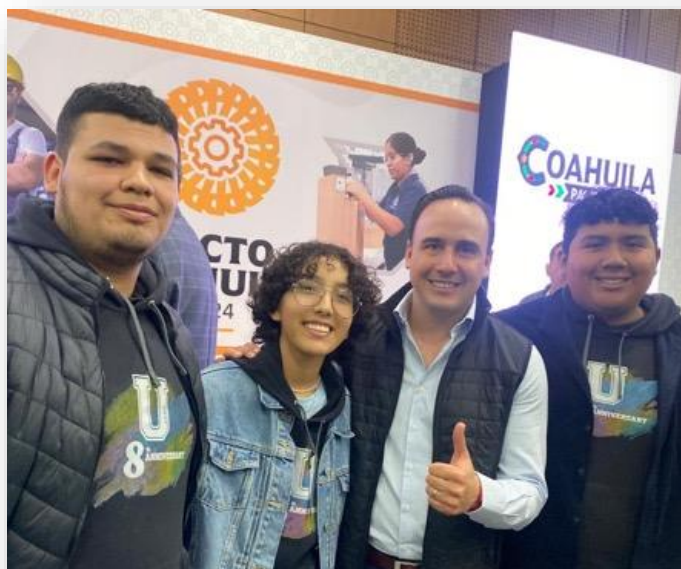
16 de febrero Asistencia a Firma de Convenio "Pacto Coahuila"