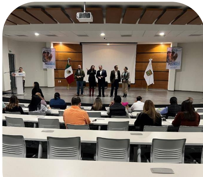
18 de octubre Asistencia a capacitación sobre PNT