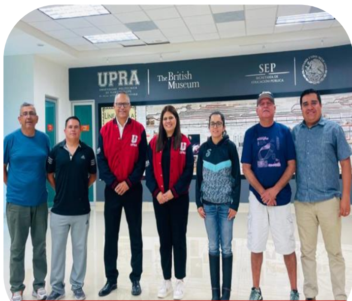
05 de septiembre Reunión con docentes de Desarrollo Humano