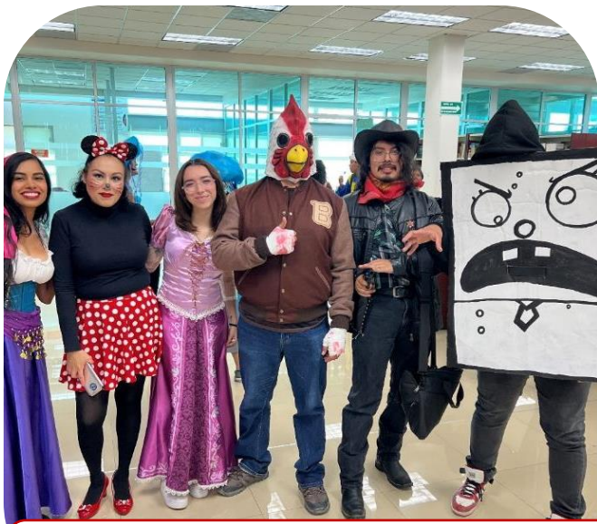
Concurso de Disfraces 31 de octubre