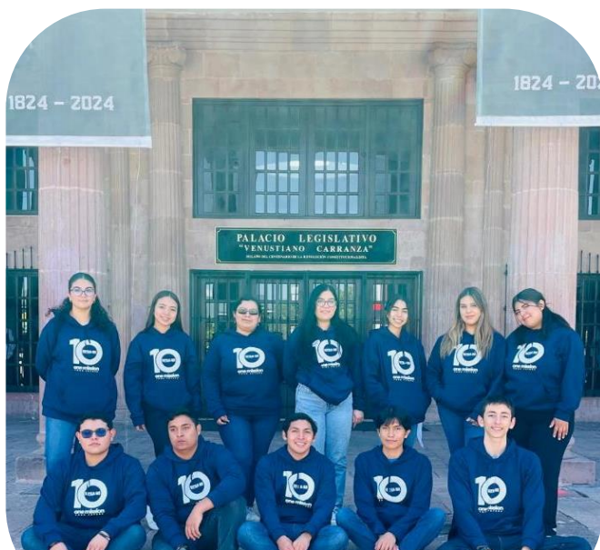
Visita al congreso del Estado 03 de octubre