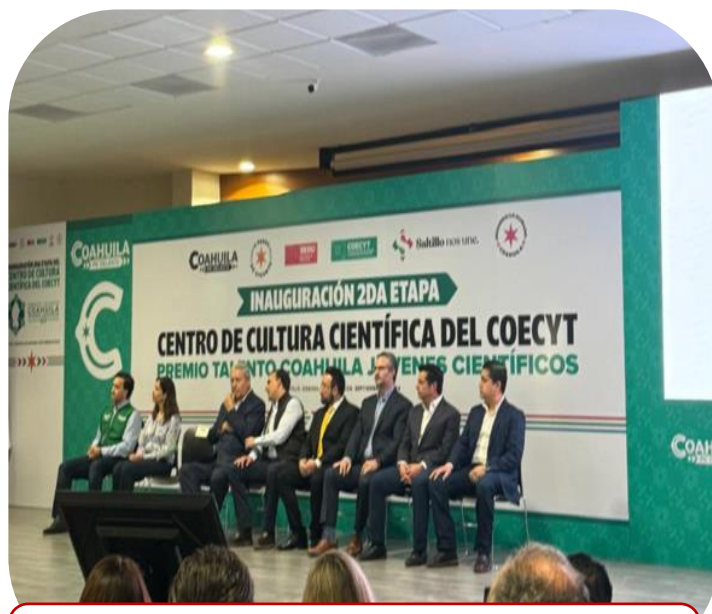
02 de septiembre Asistencia a Inauguración de segunda etapa del Centro de Cultura Científica del COECYT