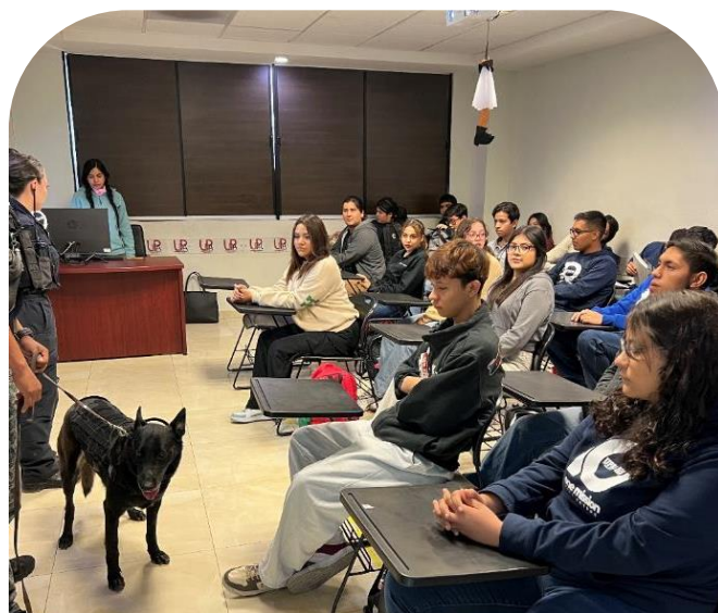
22 de octubre Operativo "Mochila Sana y Segura"