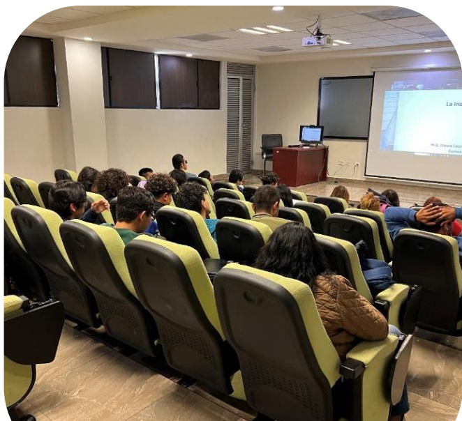
29 de noviembre Conferencia Virtual "La industria 4.0"