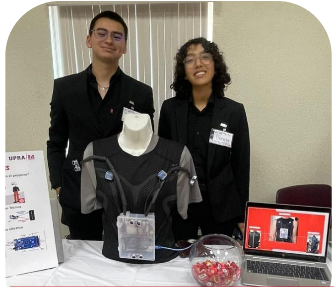
Participación en el premio a la Innovación y Desafío Pitch 2024 01 de noviembre