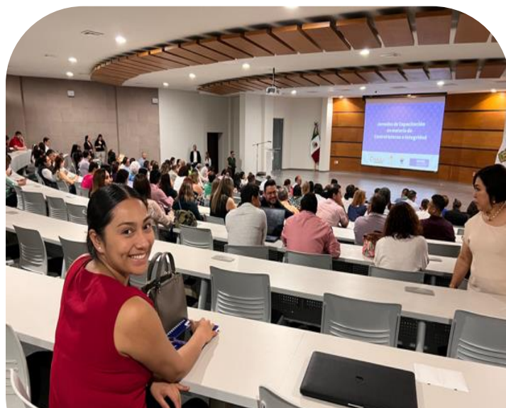
Asistencia a capacitación del comité de Ética