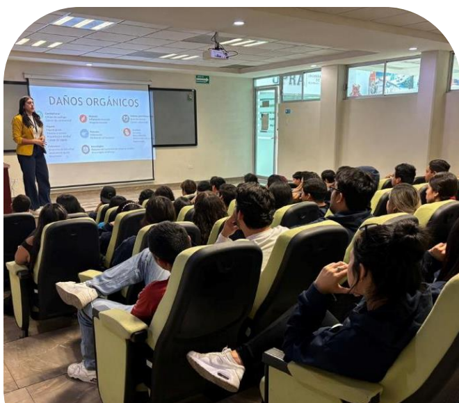
22 de noviembre Plática sobre prevención del alcoholismo