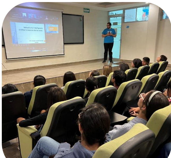
15 de noviembre Plática virtual sobre Industria 4.0 e Internet de las Cosas