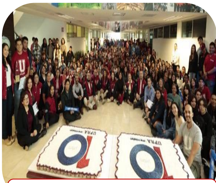
06 de septiembre Festejo por el Décimo Aniversario de la UPRA