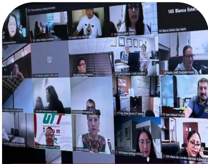
20 de agosto Reunión Virtual del Nuevo Modelo Educativo de DGUTyP