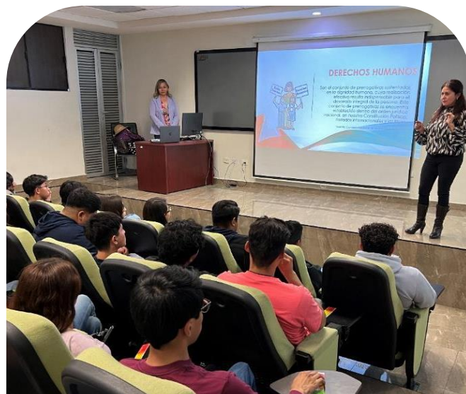
19 de noviembre Conferencia "Masculinidades Positivas o Consentimiento"