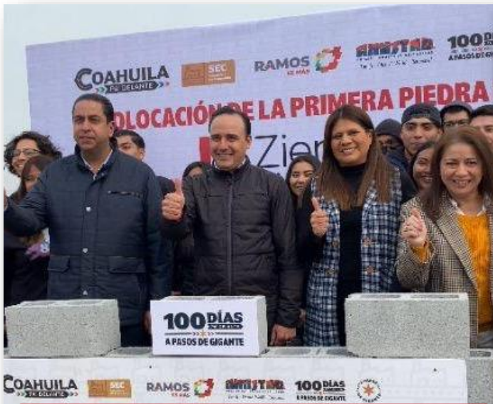
29 de febrero Asistencia a instalación de Primera Piedra de la empresa "Ziemann"