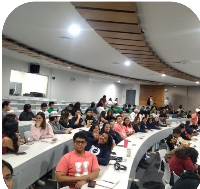
12 de noviembre Asistencia a conferencia "proyección de la disponibilidad y demanda de agua"