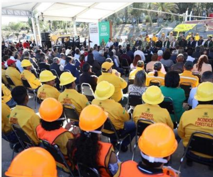
05 de marzo Asistencia al arranque del Operativo de Combate a Incendios Forestales