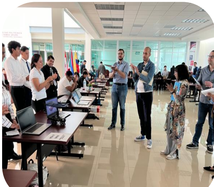
15 de agosto Feria de Proyectos integradores en UPRA