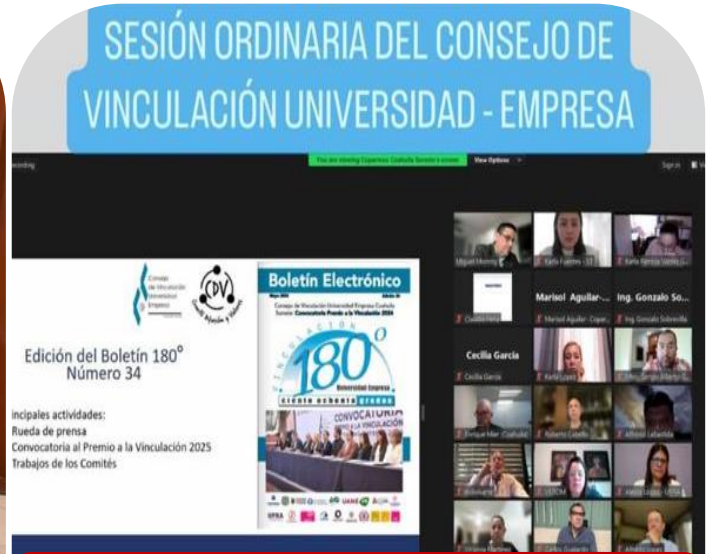
18 de junio Junta técnica del encuentro nacional cultural y deportivo de Universidades Tecnológicas y Politécnicas etapa Regional