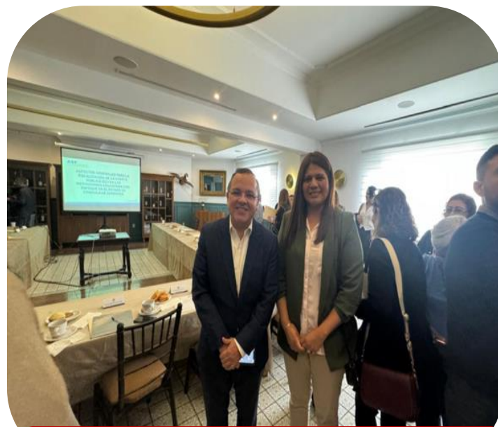
06 de septiembre Asistencia a plática de Recursos Federales Transferidos