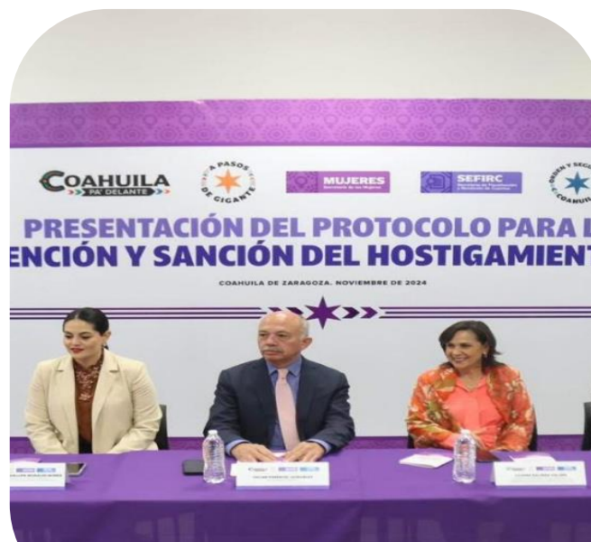
28 de noviembre Asistencia a presentación de protocolo para prevención del acoso