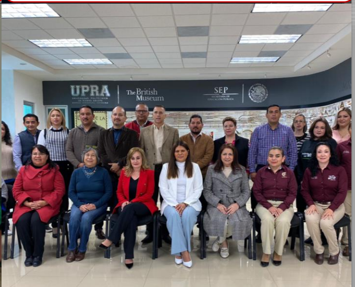
01 de marzo Reunión Informativa con Directores de Instituciones de Educación Media Superior