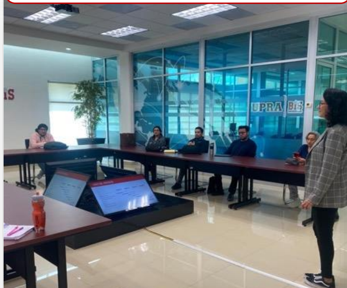
20 de marzo Reunión con docentes para revisión de lineamientos del proyecto Integrador