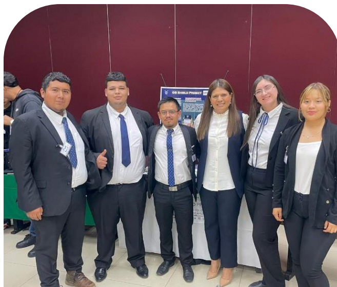
13 de diciembre Proyectos de UPRA seleccionados como finalistas en FEMECI 2024