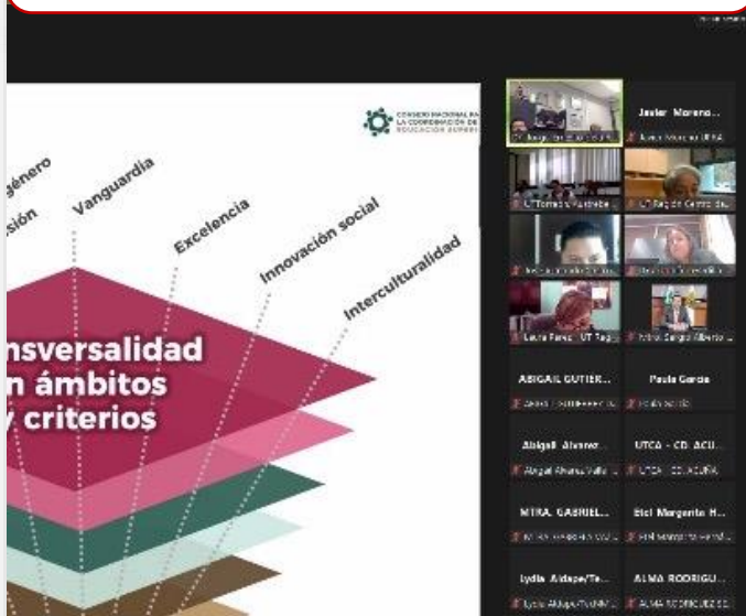
09 de febrero Reunión Virtual de SEAS