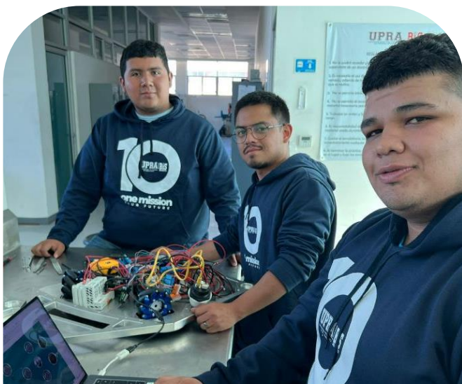
21 de octubre Participación de la UPRA en el NASA Challenge Space Apps