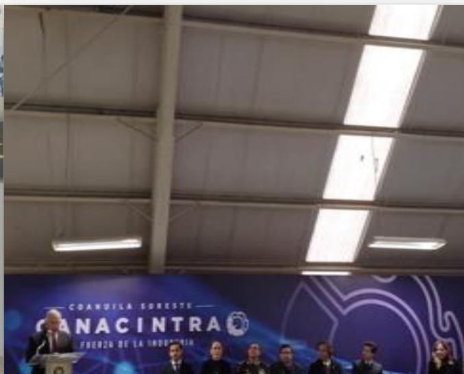
16 de enero Asistencia a la Toma de Protesta de la Mesa Directiva CANACINTRA 2024