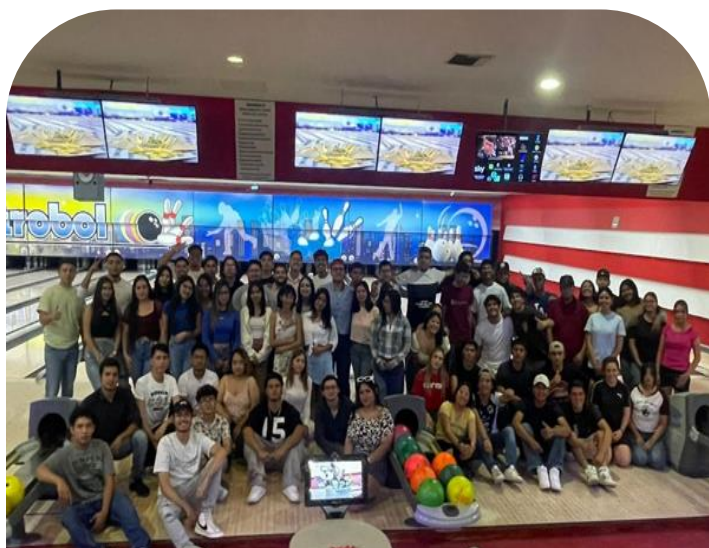
09 de mayo Convivencia de alumnos de UPRA metrobol