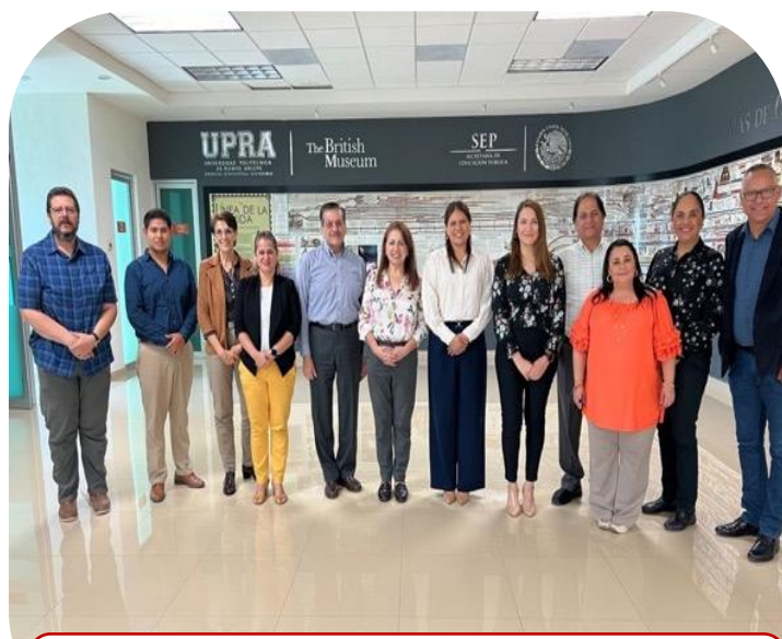
25 de septiembre UPRA sede de reunión sobre implementación del Modelo Dual