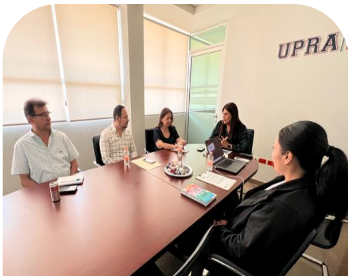
07 de mayo Segunda sesión ordinaria del comité de control interno