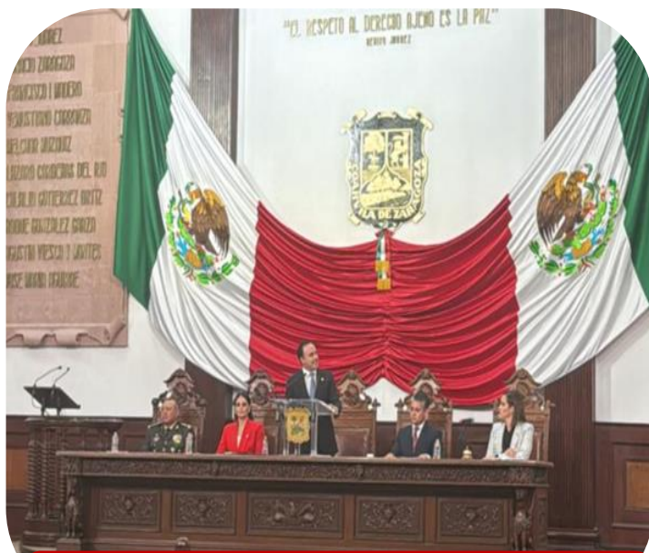
15 de agosto Sesión Solemne en el Palacio Legislativo