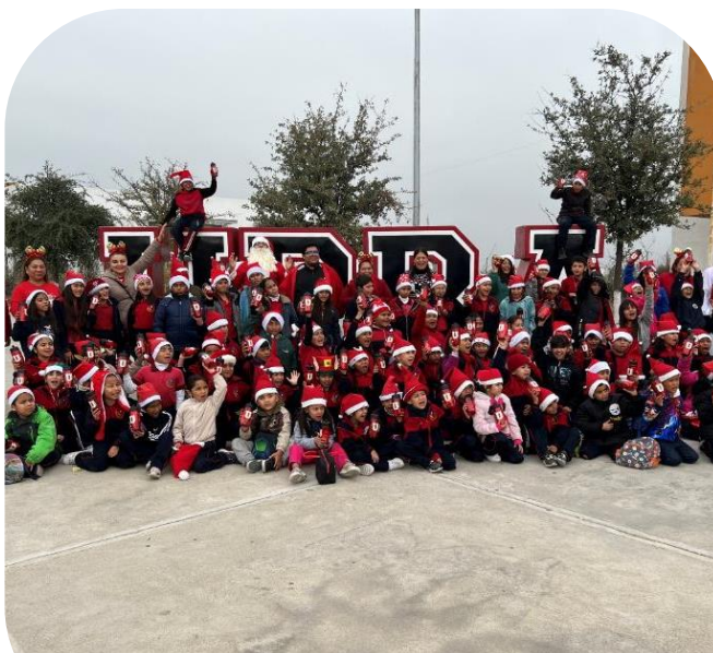
04 de diciembre Posada y Villancicos en UPRA