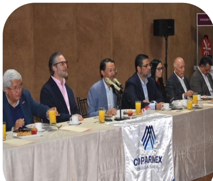
11 de septiembre Asistencia a sesión mensual de COPARMEX