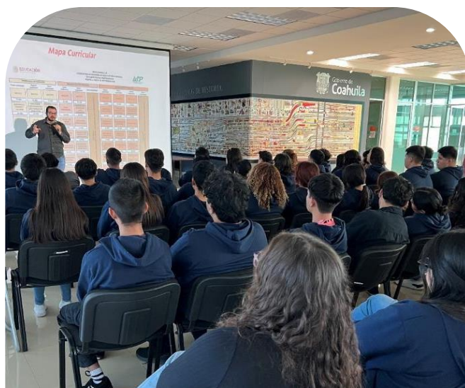
21 de noviembre Plática de Inducción a alumnos de nuevo ingreso