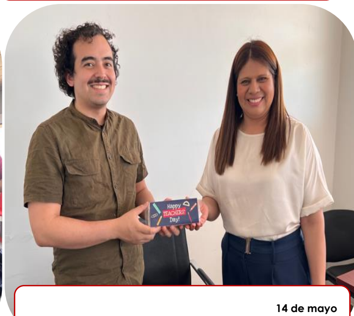
14 de mayo Reconocimiento a docentes por día del maestro