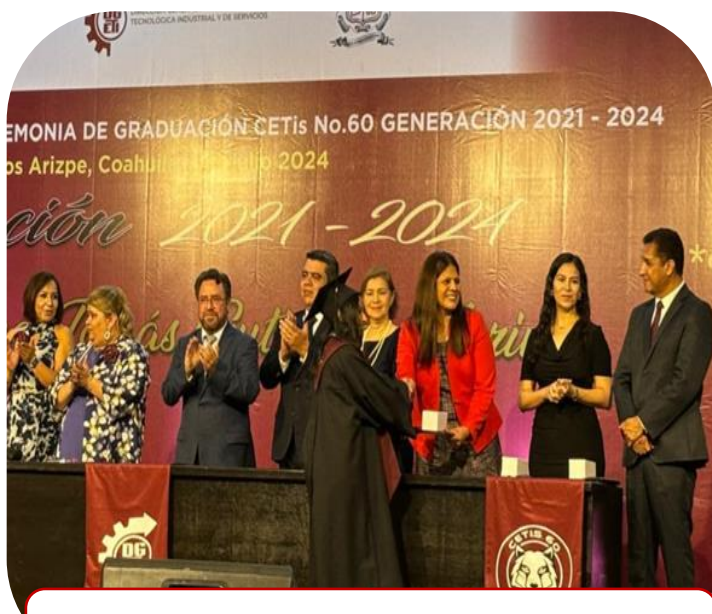
01 de julio Asistencia a graduación de CETIS 60