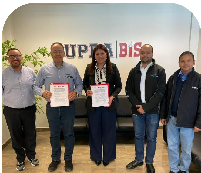
12 de diciembre Firma de Convenio con Imperial Auto México