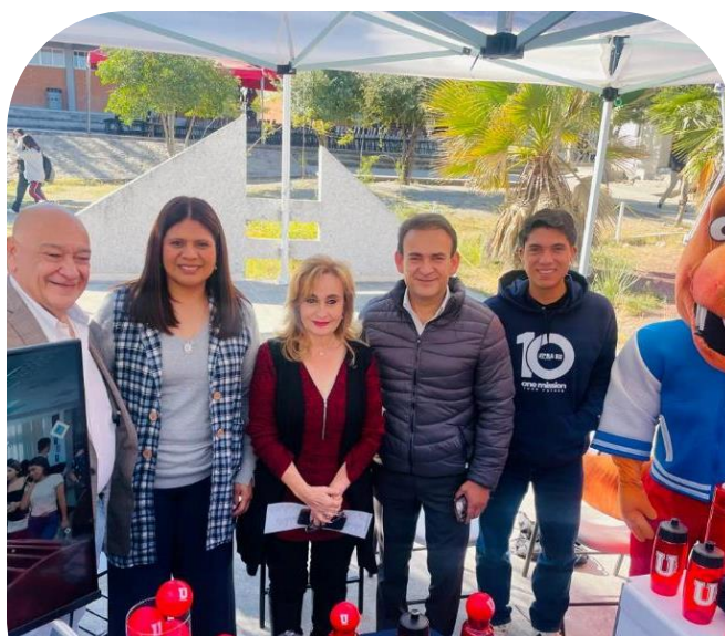
22 de noviembre Asistencia a Feria Vocacional y del empleo CECYTE 2024