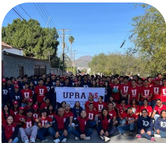
20 de noviembre Participación en el Desfile Conmemorativo del 20 de noviembre