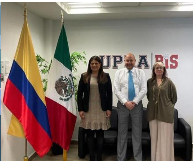
26 de febrero Visita de la Universidad América, de Medellín, Colombia, A las instalaciones de la UPRA