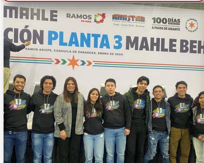
22 de enero Asistencia de alumnos y Rectoría a la inauguración de la planta 3 "Mahle behr"