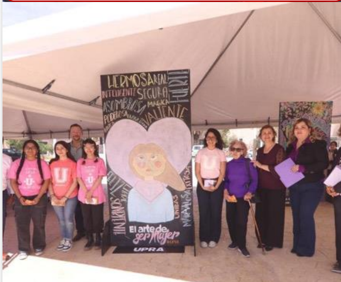
07 de marzo Alumnas de UPRA participan en elaboración de Mural "El arte de ser mujer"