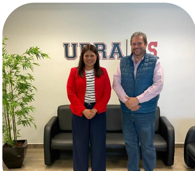
28 de noviembre Visita del alcalde electo a la UPRA