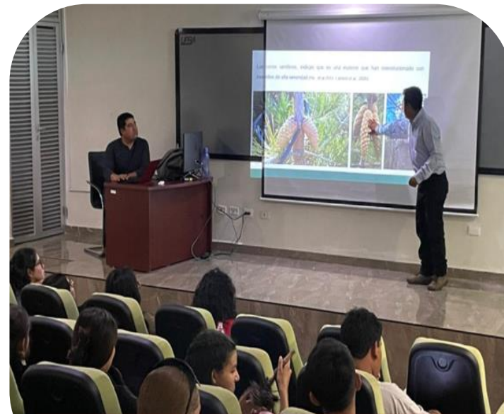
04 de julio Plática sobre incendios forestales