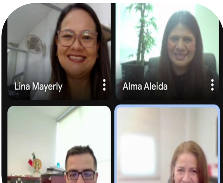
08 de agosto Reunión Virtual con el ITM - Colombia