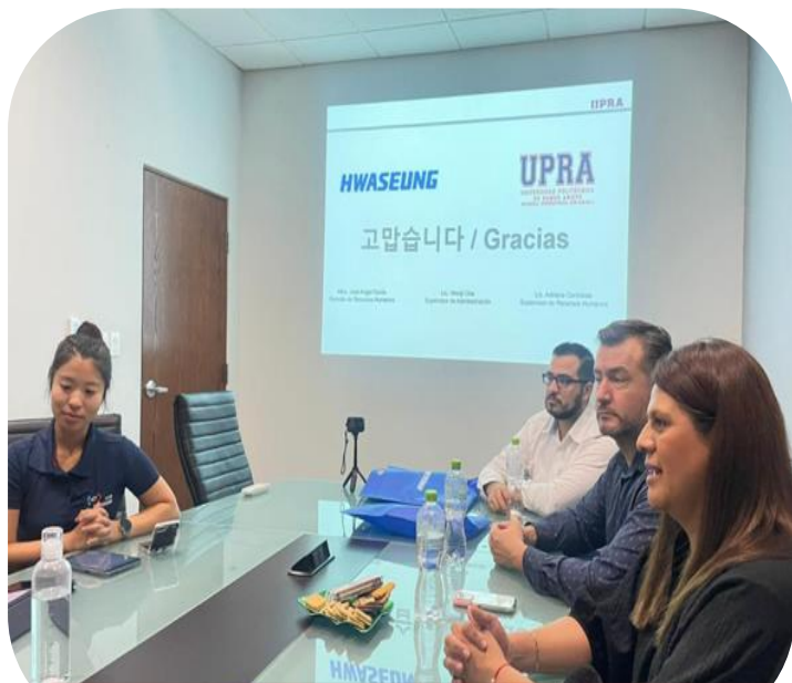
22 de agosto Firma de Convenio con la empresa Hwaseung