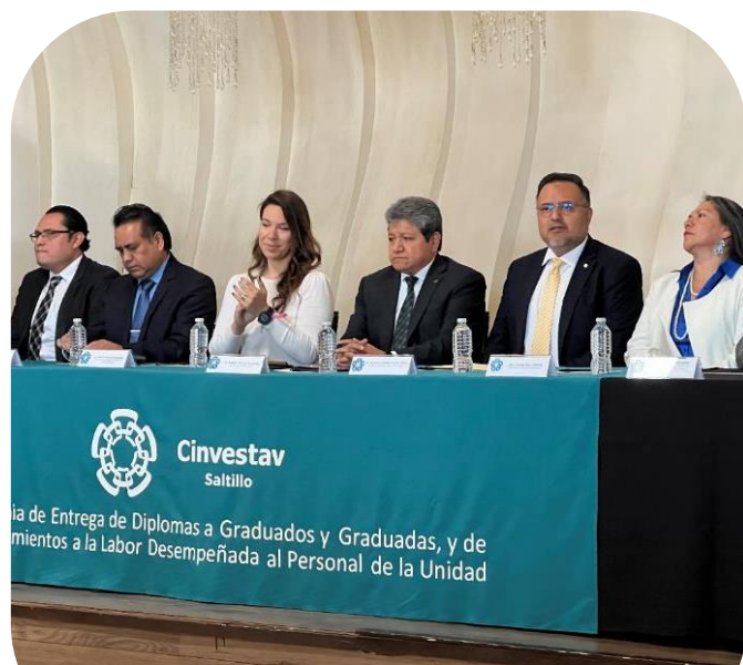
22 de noviembre Asistencia a ceremonia de graduación del Cinvestav Saltillo