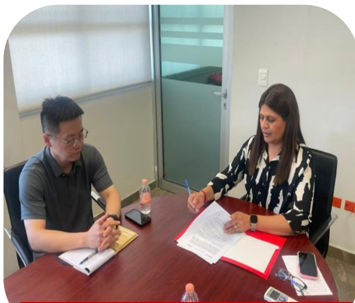
15 de agosto Firma de Convenio con empresa Jiaxipera