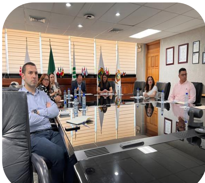
Tercera sesión ordinaria de la H. Junta Directiva