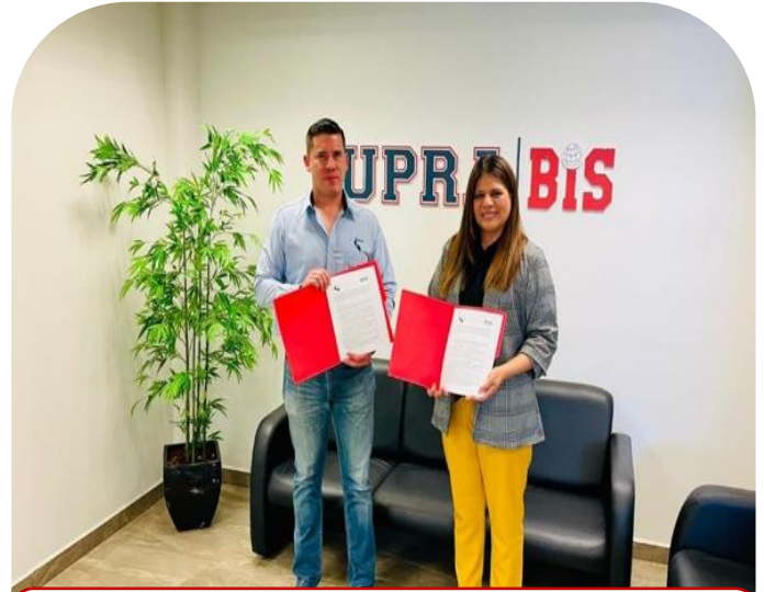
08 de Abril Firma de convenio de colaboración con la empresa "samsung"