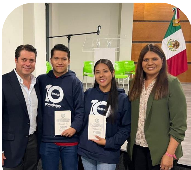
31 de octubre Alumnos de UPRA en la integración de Comité Estudiantil