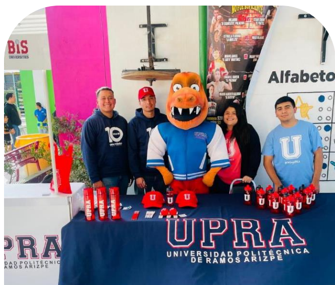
14 de noviembre Participación en Brigadas "MEJORA Coahuila"