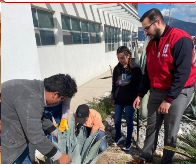
28 de febrero Alumnos de la UPRA realizan actividades de cuidado y renovación de áreas verdes