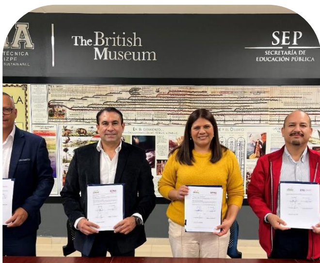
21 de noviembre Firma de Convenio con Colegio de Bachilleres de Coahuila