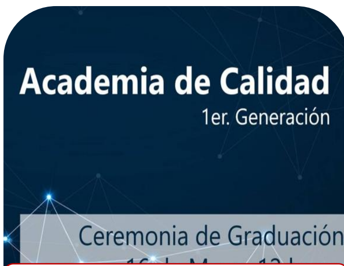
03 de junio Ceremonia de Graduación de Academia de Calidad LEAR