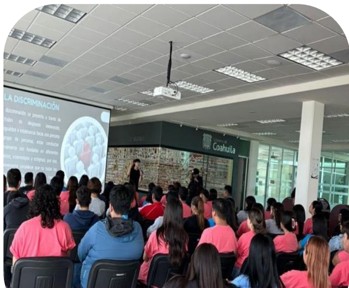
24 de septiembre Plática a alumnos de nuevo ingreso sobre discriminación