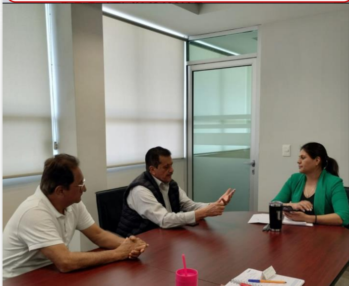
29 de febrero Reunión de Seguimiento a implementación de Modelo DUAL en UPRA