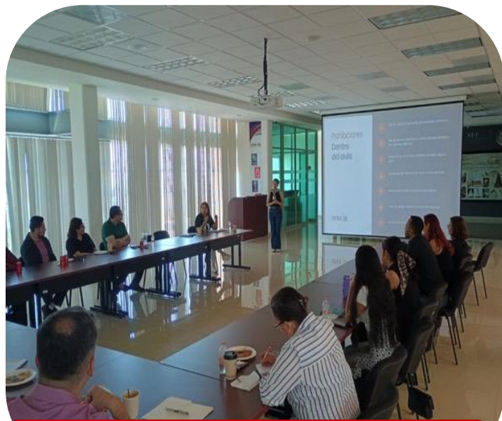
28 de agosto Reunión con docentes para arranque de Ciclo Escolar