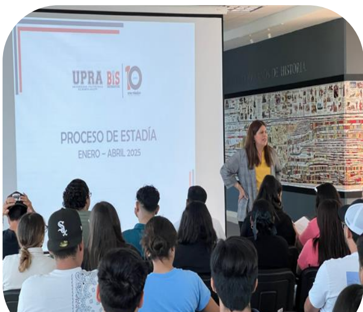
26 de septiembre Reunión con alumnos de noveno cuatrimestre para Estadía Profesional