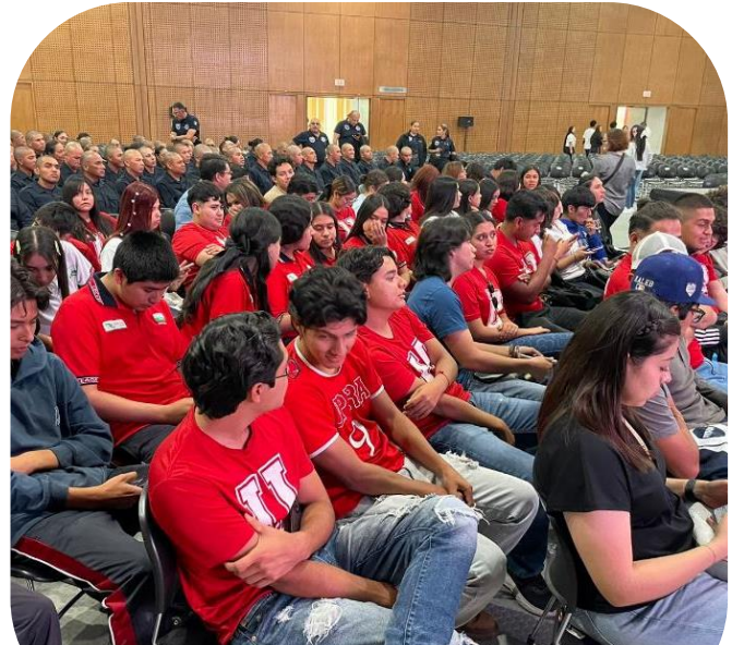
Asistencia a conferencia "La Era de la Inteligencia Artificial" 06 de noviembre