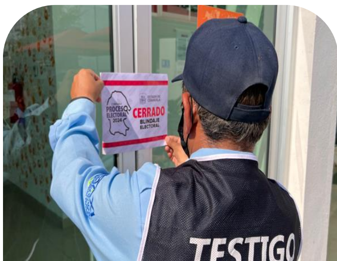
31 de mayo Actividades en materia de Blindaje Electoral