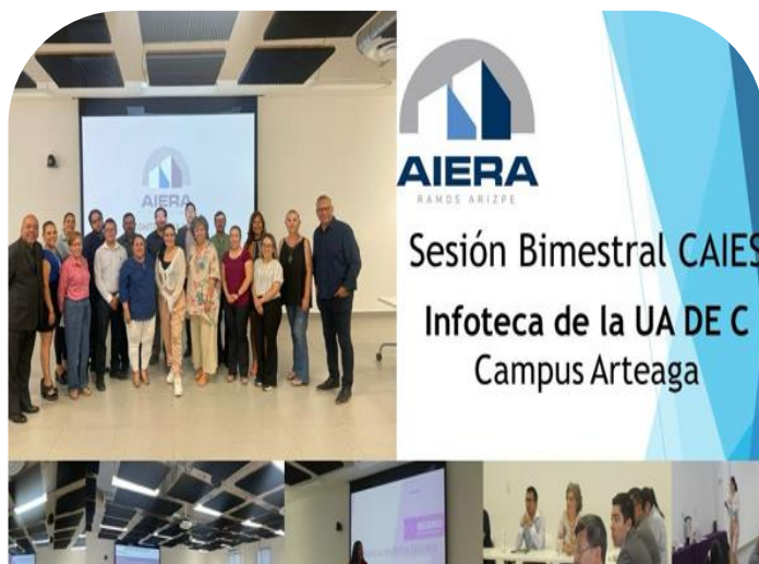
21 de mayo Asistencia a sesión bimestral del comité CAIES AIERA