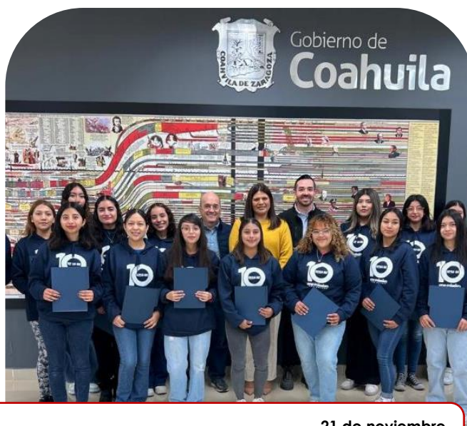
21 de noviembre Firma de convenio y entrega de becas con Fundación Holcim