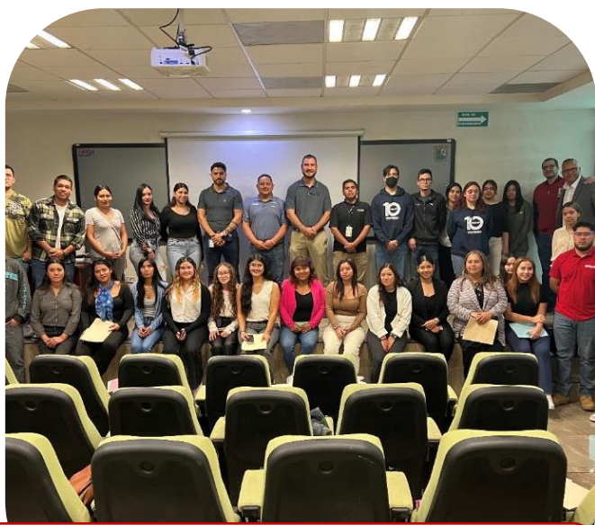
16 de octubre Evento de reclutamiento de empresa "PUREM"