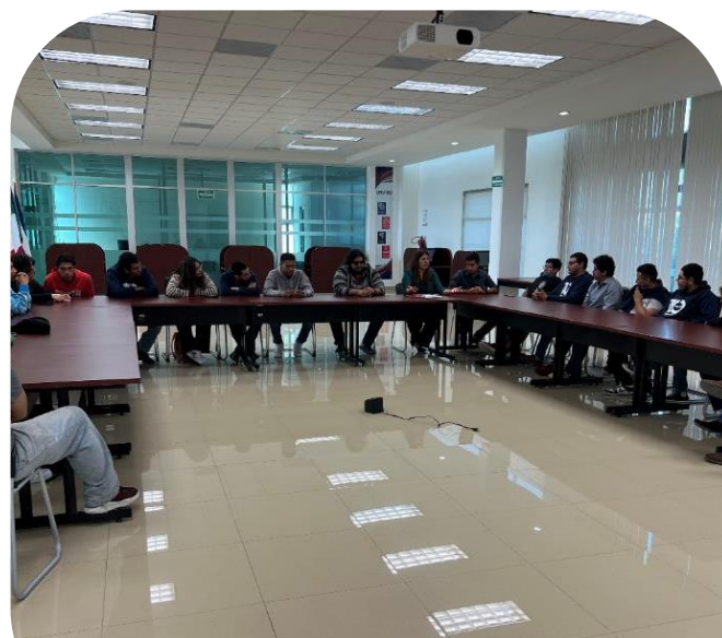
23 de octubre Plática con jóvenes universitarios