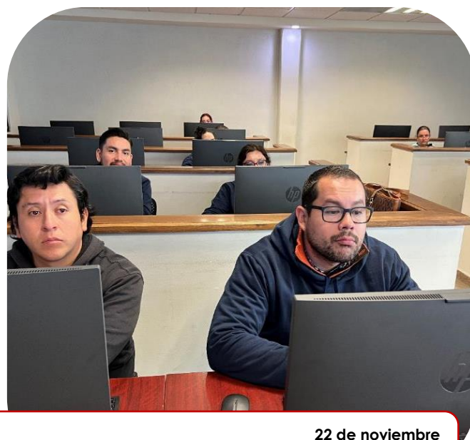
22 de noviembre Capacitación a personal administrativo y docente en materia de ética y control interno