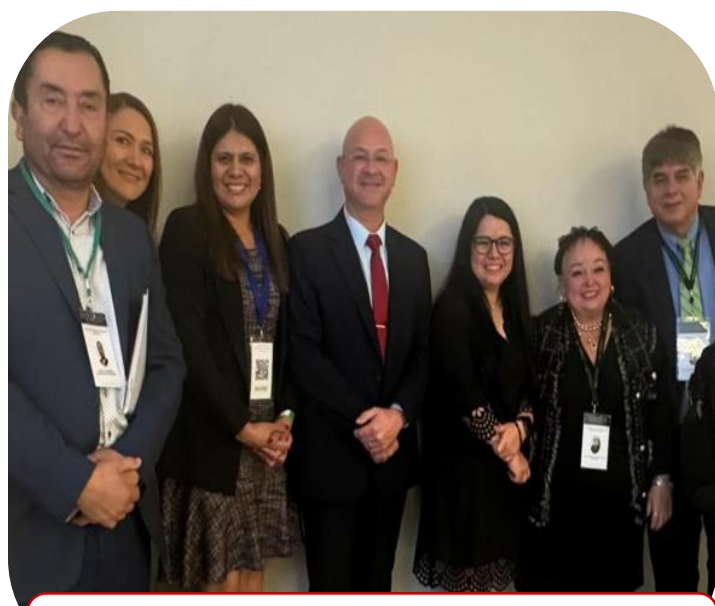
09 de septiembre Asistencia a la Segunda Reunión Nacional de Rectores 2024