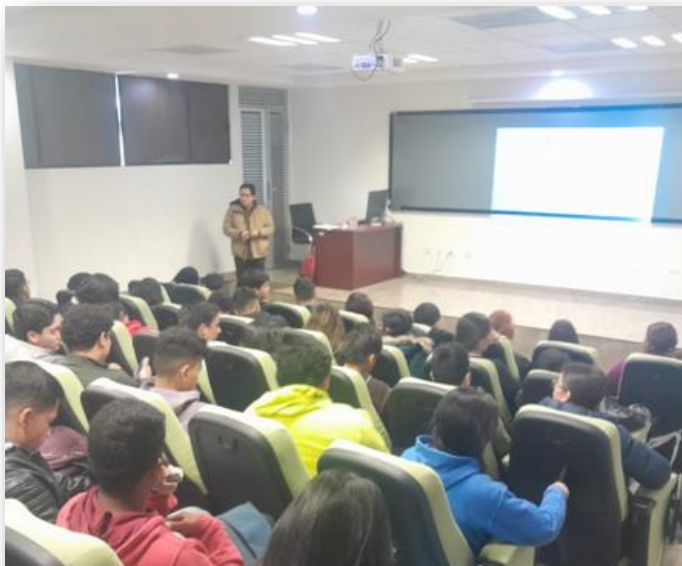
12 de febrero Plática de SEDU para alumnos de UPRA sobre nuevas masculinidades