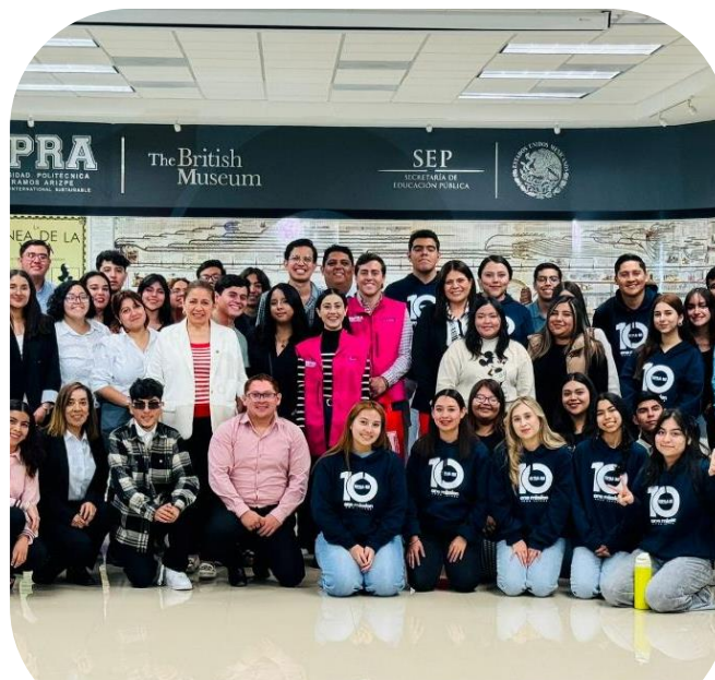
13 de noviembre Consulta ciudadana "Lo que sientes importa"