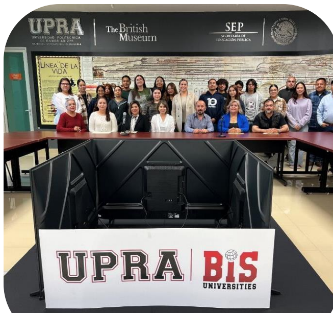
19 de noviembre Taller de andamiaje literario