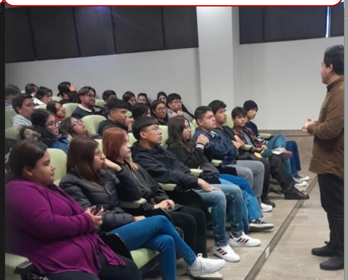
09 de febrero Reunión con alumnos de programas 21+ para estadías