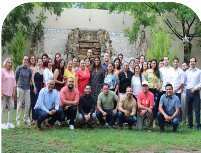
30 de mayo Festejo día de la madre, del padre y del maestro