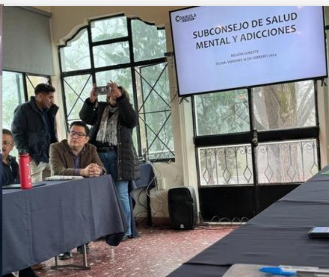
16 de febrero Instalación del Subcomité de Salud Mental y Adicciones Sureste