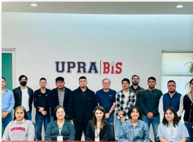
08 de febrero Visita de la empresa "COPELAND" a las instalaciones de UPRA